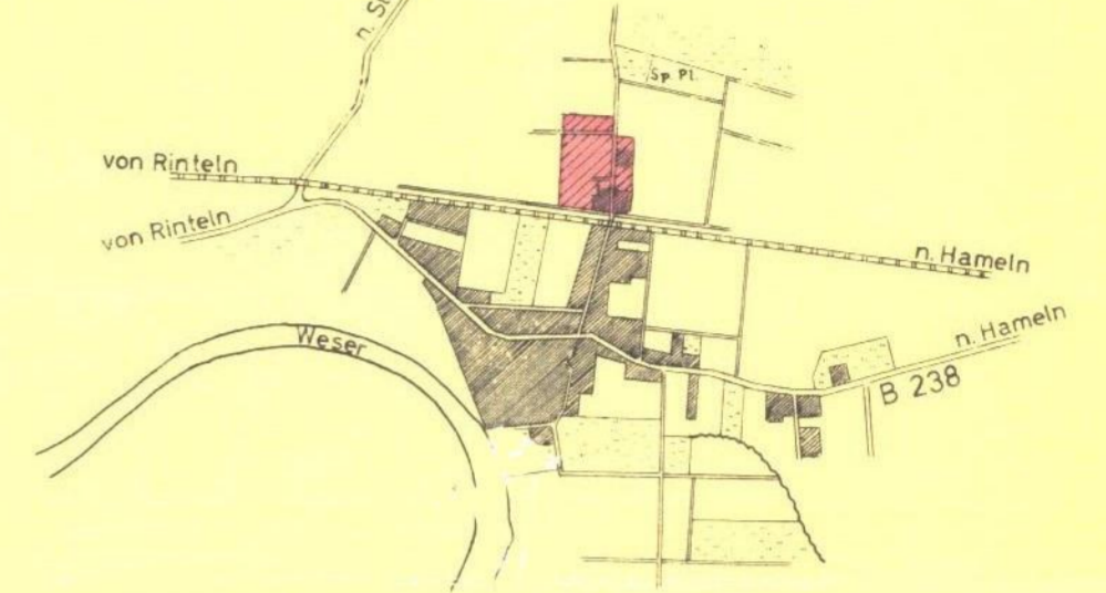
SITUATION IM MAßSTAB 1 : 25 000