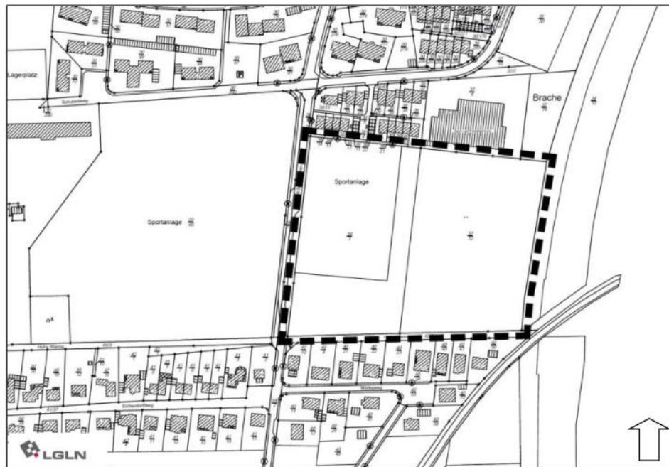
Geltungsbereich des Bebauungsplans Nr. 84 „Kurt-Schumacher-Straße (Ost)“ Kartengrundlage ALK

Ziel der Aufstellung des Bebauungsplans Nr. 84 „Kurt-Schumacher-Straße (Ost)“ ist es, die planungsrechtlichen Voraussetzungen zur Entwicklung eines Wohngebiets mit einem Wohnraumangebot im Geschosswohnungsbau sowie einer Einrichtung für betreutes Wohnen mit tagesstrukturierenden Maßnahmen eines sozialen Trägers, um der Nachfrage nach entsprechenden Wohnungen gerecht zu werden. Der Geltungsbereich des Bebauungsplanes Nr. 84 „Kurt-Schumacher-Straße (Ost)“, Ortsteil Rinteln, ergibt sich aus der nachstehend abgedruckten Karte: