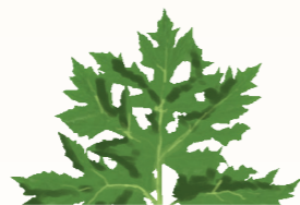
Blüte (Dolde) weiße Blütenstände Durchmesser: 50-100 cm