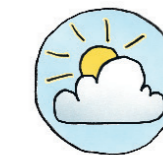
Hohe UV-Strahlung vermeiden!